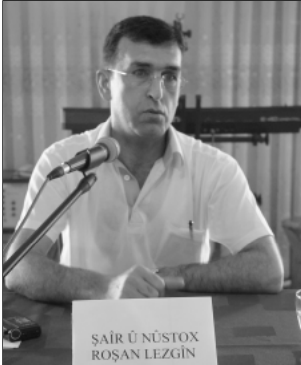
Roşan Lezgîn Çewlîgî de

Program de Roşanî yew şîra xo (Ruho Vîndîbîyaye) zî wende. Peynî de Roşanî da-hîris tene kitabê xo îmza kerdî û wendoxanê xo reyde